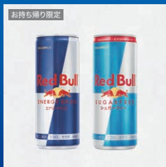
レッドブル 250ml 2種いずれか1つ