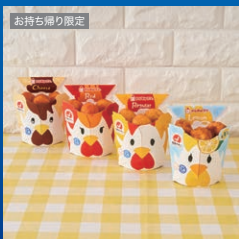
からあげクン 各種いずれか1つ