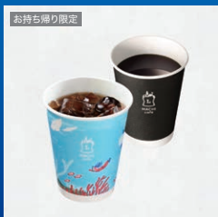
MACHI caféドリンク(S) (1杯)