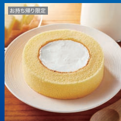
ウチカフェプレミアムロールケーキ

都合により商品が変更になる可能性がございます。商品受け取り方法は裏面をご覧ください。スマートフォン以外の端末ではご利用いただけません。