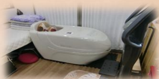
健康機器 ハーフドーム