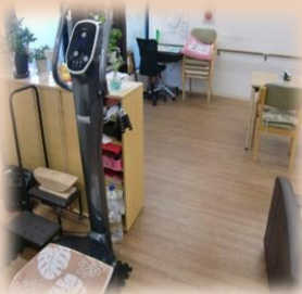
健康機器 ドドンパ