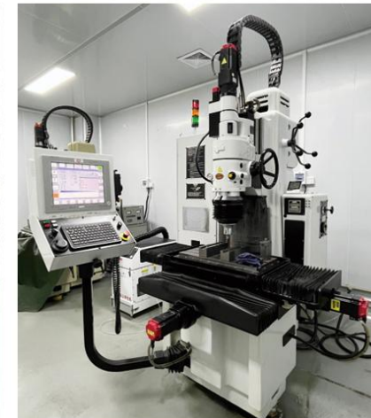
〈 JG研磨加工 〉