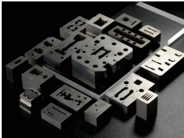
〈 超硬 (タングステン) 材の加工 〉