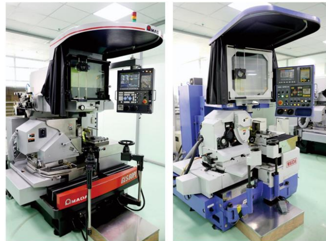
〈 プロファイル研磨加工 〉