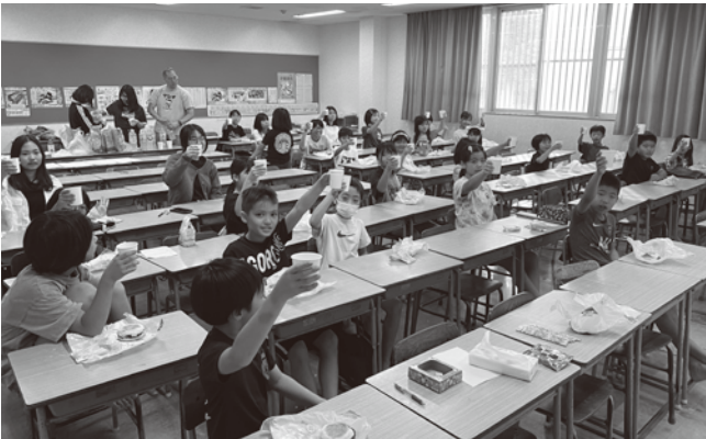
合宿がんばるぞ カンパイ!

○送迎の際、本校前の道幅が狭いため、本校前の坂下から坂上への流れのご協力に心より感謝いたします。今後とも交通緩和のため、ご理解とご協力をよろしくお願いします。