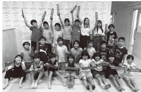
毎日練習に来ています!