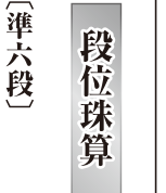
大城 杏莉 (長田小四年)