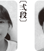
前富里 日大 (仲西中二年)