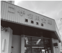
展示会場コザ信用金庫

去る、六月六日(金)から二十三日(月)まで、コザ信用金庫浦添支店より依頼があり「そろばん展示会」を行いました。長尺そろばんや古そろばんなど、そろばんに関わる物、三〇点ほど展示しました。見ていただいた方が、なつかしく思ってもらったり、関心を持っていただけたの幸いです。