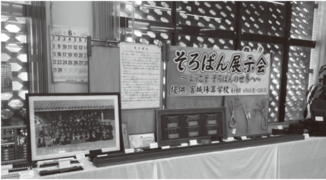
そろばん展示会のようす

夢を叶えさせるにはどのようなしたら良いのか等、良いお話がたくさん拝聴することができました。受講された生徒や保護者の皆様にとって良い刺激やヒントになったのなら幸いです。