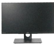
WG4専用モニター (23.8インチ)