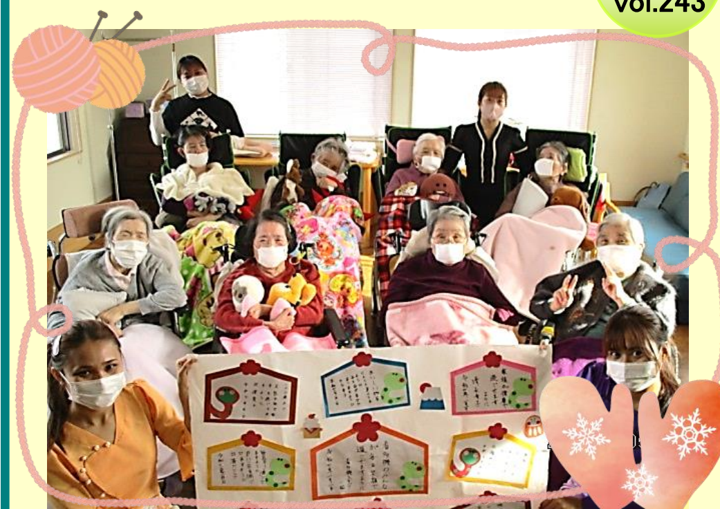
看護小規模多機能型居宅介護 長谷川