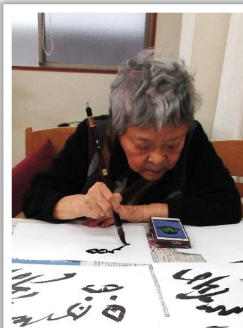
年始に向けて、書初めの練習