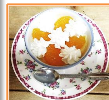
カツカレーや握りずし、手作りプリンなど、年末はご馳走のオンパレード！

中央西事業所ではこれからも、季節感を大切にし、利用者様のご要望に応じて行事を楽しんでいただけるように工夫して参ります。今後ともご指導のほど宜しくお願い致します。