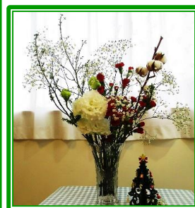
Xmasの飾り付け。 生け花は利用者様の作品です。