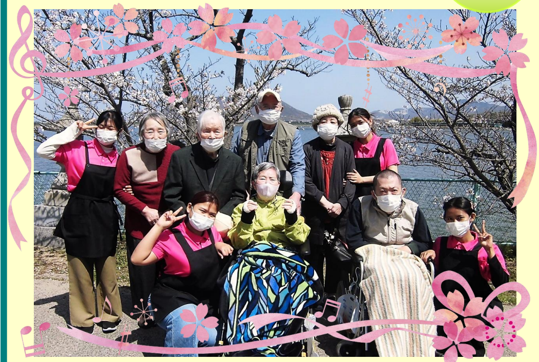
ケアサポート長谷川(古高松)

株式会社 ケアサービス長谷川 〒760-0061 高松市築地町8-17 TEL：087-851-2916 FAX：087-851-0700