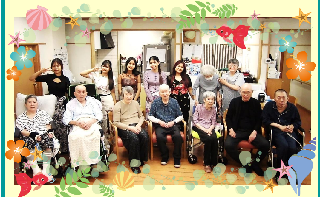
ケアサポート長谷川(古高松)