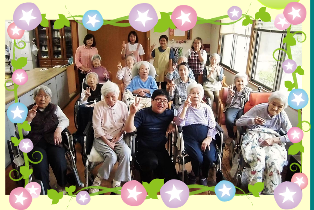
グループホームミモザ

株式会社 ケアサービス長谷川 〒760-0061 高松市築地町8-17 TEL: 087-851-2916 FAX: 087-851-0700