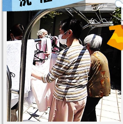
梅雨の晴れ間を有効活用！