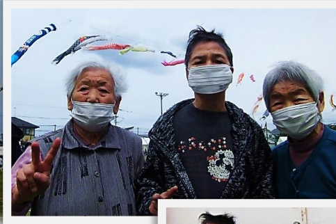
競技に参加して綿菓子いただきました。