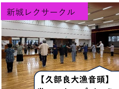
新城レクサークル