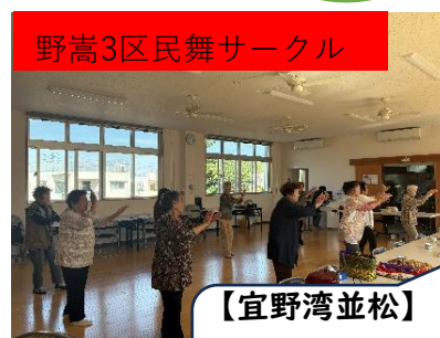
野嵩3区民舞サークル