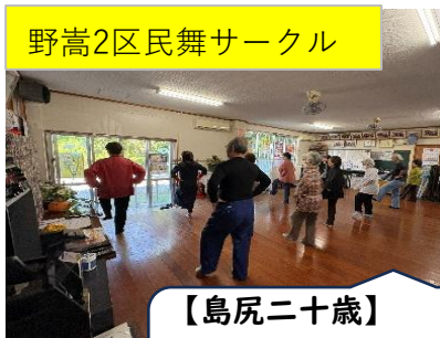
野嵩2区民舞サークル