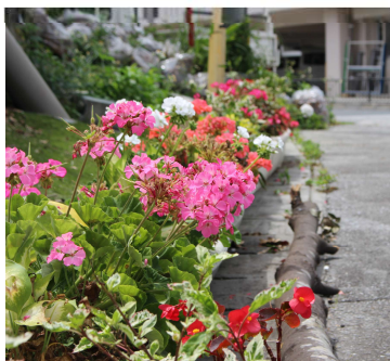
嘉数ハイツ(パイプライン通り)

日頃、みんなが安心して通れるのも、気持ちよく通れるのも、各地域で取り組んでいる清掃美化活動や花植え活動のおかげです。今月は、下写真の地域で癒されてきました～！