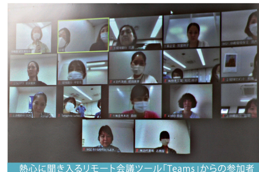
熱心に聞き入るリモート会議ツール「Teams」からの参加者

この例会が開催された当時の沖縄県は、新型コロナの新規感染者数(人口10万人比)が全国最多を記録する日が続いており、このテーマについての関心は高く、約60名の参加者から多くの質問を頂きました。