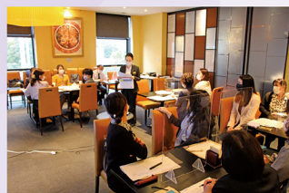
会場は広々レイアウト!にも関わらず 深い交流ができました