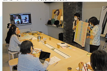
会場・オンライン両方から発表

一方で「接客業と事務でテレワーク等の働き方の不公平感がある」「効率性・生産性を何で図るか」など、解決したい課題も多く上がり、新しい働き方について各々が考える時間になりました。