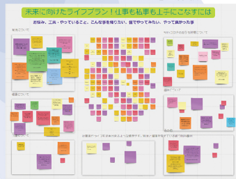
「習うより慣れる!」 オンラインホワイトボード「Milo」を体験