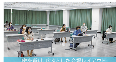
密を避け、広々とした会場レイアウト