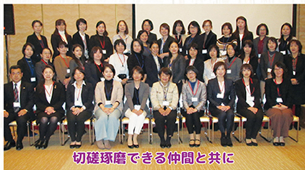
切磋琢磨できる仲間と共に