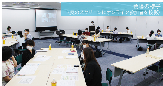
会場の様子 (奥のスクリーンにオンライン参加者を撮影)