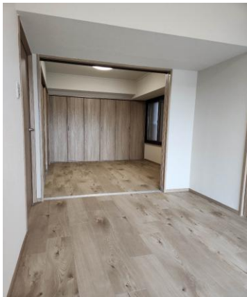
【お部屋からの眺望】