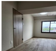
【食洗機付キッチン】